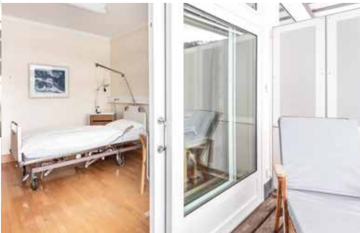
Einblicke in ein Doppelzimmer