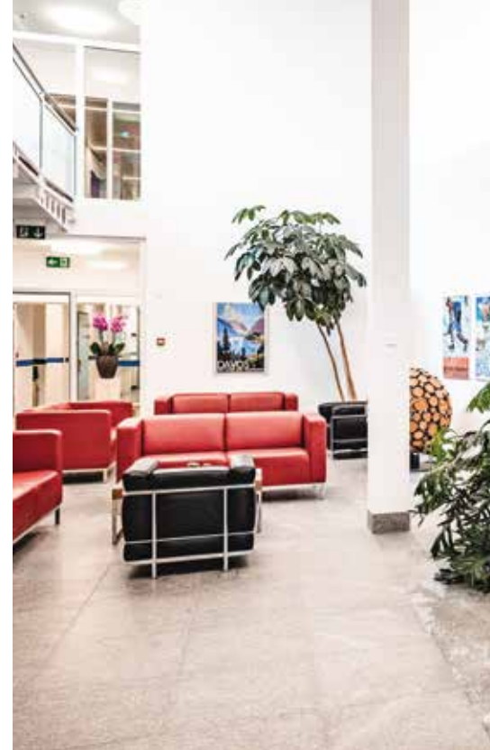
Verschiedene Rückzugsmöglichkeiten im Klinikinnern (oberstes Bild), im Freien (mittleres Bild) oder in der Lounge für Zusatzversicherte* (unteres Bild)

Einen besonderen Namen hat sich unsere Klinik Davos unter anderem mit ihrer Fachexpertise in den Gebieten der Einschränkungen des Bewegungsapparates, Rehabilitation von Patienten mit chronischen und chronifizierten Schmerzen, somatoformen Störungen, Wund- und Stomabehandlung, Rehabilitation nach Lebertransplantationen sowie bei Krebspatientinnen und -patienten gemacht. Die konsequente Weiterentwicklung ist dabei selbstverständlich.