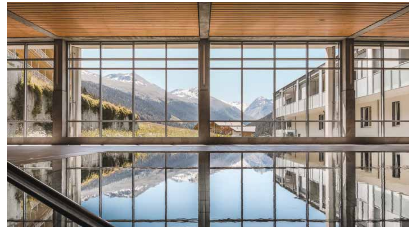
Therapiebad mit fantastischem Ausblick

Die Klinik Davos verfügt wohl über eines der schönsten Therapiebäder in der Rehalandschaft. Die Cafeteria und das Restaurant Miramunt sind hell und modern gestaltet. Ebenso die verschiedenen Therapieräumlichkeiten.