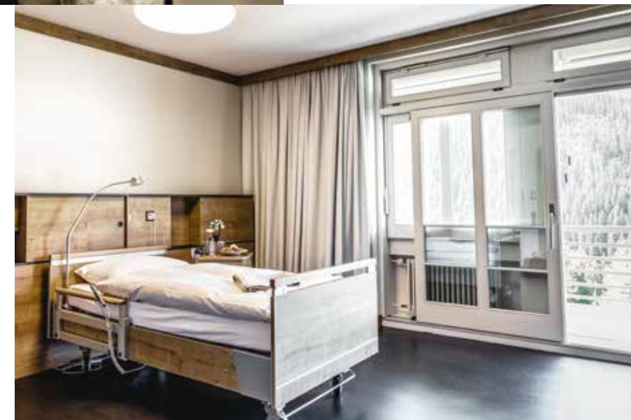
Einzelzimmer auf der Privat- abteilung