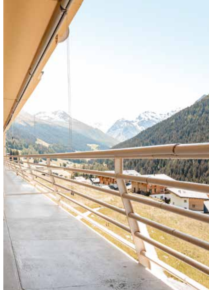
Ausblick vom Zimmerbalkon

Nebst einer modernen technischen Ausstattung mit Fernseher und kostenlosem WLAN stellen wir Ihnen gerne Erfrischungen – aus hauseigener Mineralwasserquelle – in Ihrem Zimmer bereit.