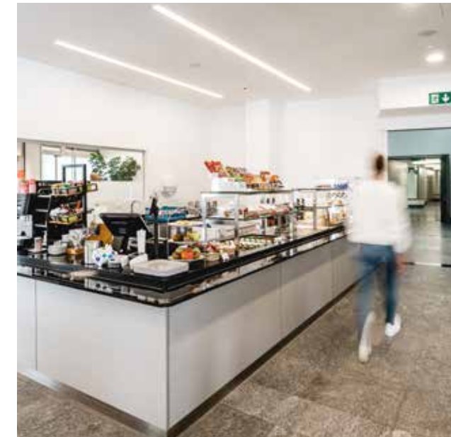
Cafeteriaangebot (links) und unser Patienten-Restaurant Miramunt (unten)