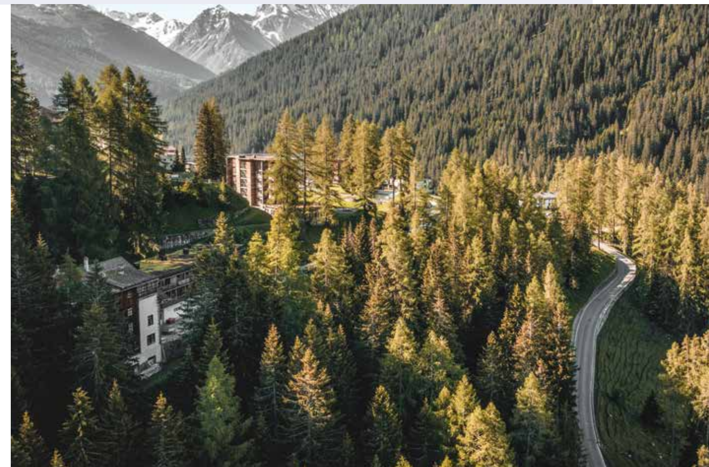
Umgeben von unberührter Natur – Klinik Davos

360 Grad unberührte Bündner Berg- und Waldlandschaften, eine wundervolle Ruhe sowie erstklassige medizinische Betreuung an einem Ort vereint. Gibt es bessere Voraussetzungen für einen Rehabilitationsaufenthalt? Herzlich willkommen in unserer Klinik in Davos Clavadel.