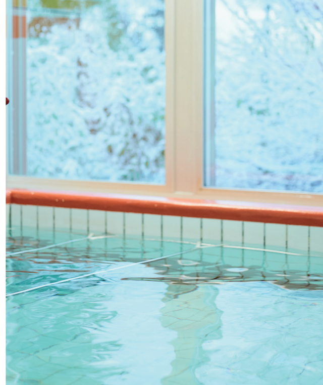
Therapiebad und Turnhalle