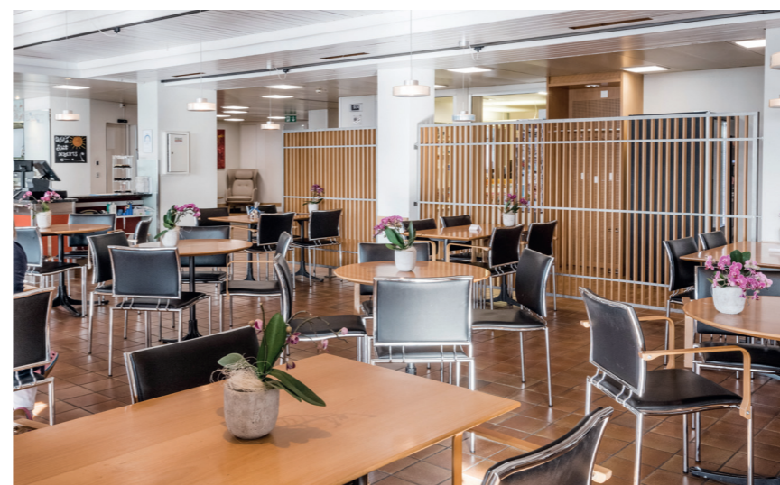
Cafeteria mit grosser Terrasse und täglich hausgemachten Köstlichkeiten

In beinahe allen Therapieräumlichkeiten kommt man in den Genuss eines wunderbaren Ausblickes ins Grüne.